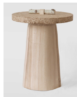
NOT WASTED par Cédric Breisacher Fibois Île-de-France