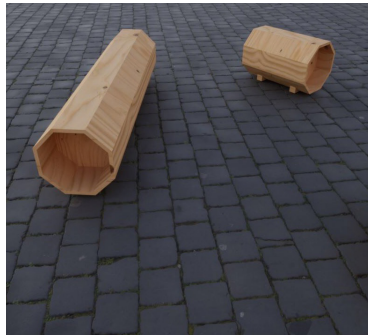
GRUME par Guillaume Thireau Fibois Bretagne