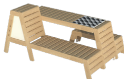
Équipe SPATIONEF CAUE 77