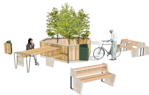
Équipe Songes et Jardins