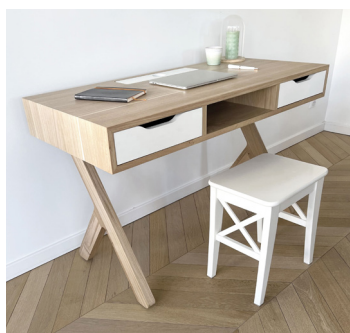
REMINI-SENS par Deschaumes Fibois Centre-Val de Loire