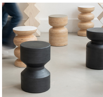
A-Serie par Maison Fifteen Fibois Auvergne-Rhône-Alpes