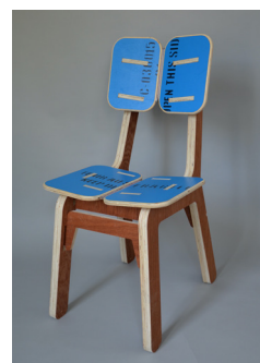
Chaise Bleue par KOZ architectes Fibois Île-de-France

Appels à projets « Design et Bois Français », sont organisés par Fibois Centre-Val de Loire, Fibois Auvergne-Rhône-Alpes, Fibois Île-de-France et Fibois Bretagne. Le concours Bois & Design est organisé par Fibois Normandie. Le concours « Mobilier urbain en bois feuillu Seine-et-Marnais » est organisé par le CAUE 77.