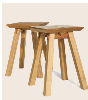
Hagi par Julie Baert, Studio JNOB Fibois Normandie