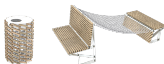
Équipe SI ARCHITECTES CAUE 77