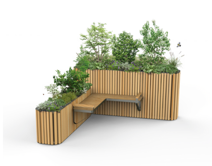
EDEN par Jérôme Boissière Design Studio Fibois Auvergne-Rhône-Alpes