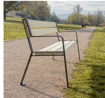
Le Forézien par TF URBAN Fibois Auvergne-Rhône-Alpes