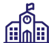
OF & CFA